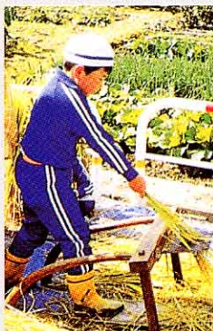
▲120年前ごろ (千ばごぎ)