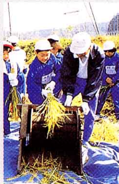
▲60年前ごろ (足ぶみだっこくき)