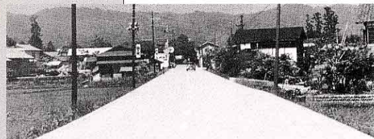
▲大きくなった会津高田町

会津高田町が生まれ た次の年に「昭和洪水」といわれる大洪水があり、わたしたちの町も大きな被害をうけました。しかし、その後、10年の間に、町はしだいに発展し、町営住たくをたてて、転入して来る人をむかえ入れ、町の商店がいもにぎやかになってきました。