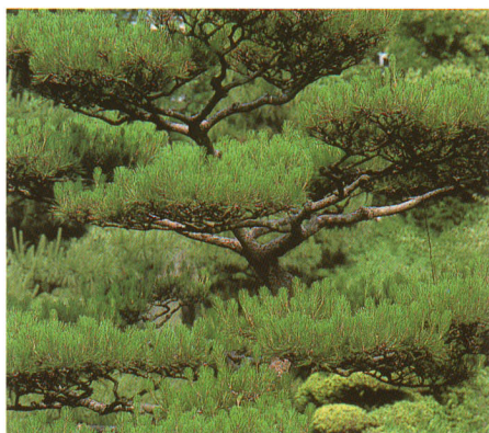
【町の木・アカマツ】

町のシンボル白鳳山一带にアカマツ林が広がり、昔は家庭・焼物の貴重な燃料源であった。