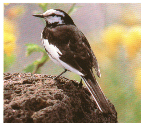
【町の鳥・セキレイ】

会津の春は渡り鳥とともにやってくる。田植えが始まる頃、黒地に白色の羽根を誇らしげに飛び交う。