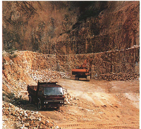
たくさんある原料

会津本郷焼は平成5年、通産省から伝統的 こうげい 工芸品の産地として指定を受けました。