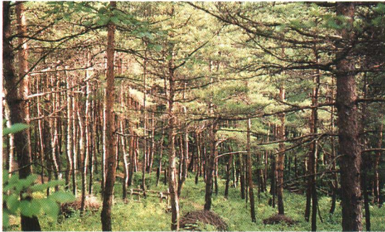
はくほう 白鳳山に自生する赤松林

町がもっている焼き物づくり ゆうり じょうけん に有利な条件はほかにもありました。