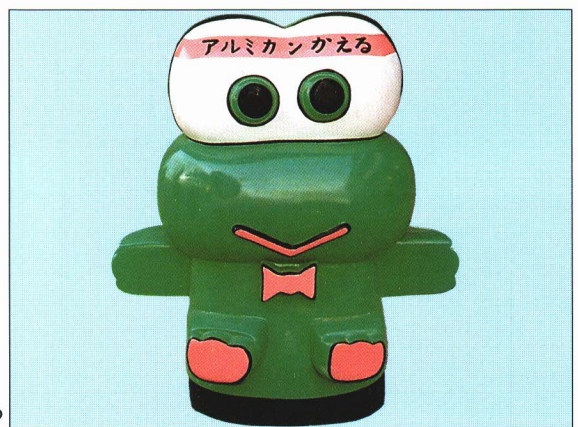
アルミかん集めのかえる