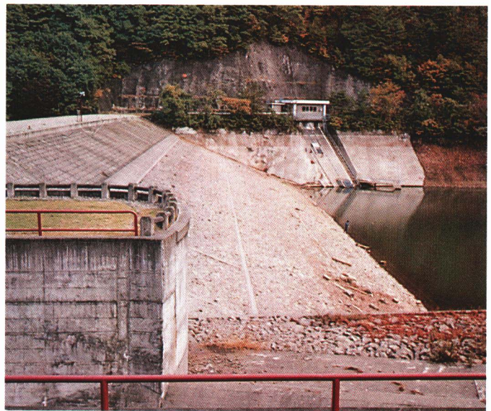
とちざわ 栃沢ダム

こうした洪水の被害から人々を守るために、氷玉川の上流の栃沢地内に、栃沢ダムができました。 1964（昭和39）年に工事が始まり、9年後に完成しました。