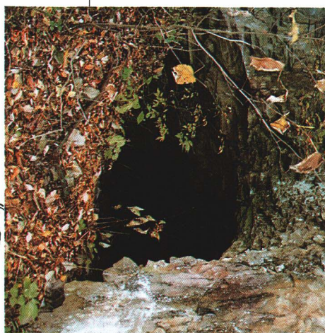
かたぎいわどうくつ 堅木岩洞窟

ろの遺跡が、大川や氷玉川の流 れにそって発見 されています。 また岩穴 あな の中で 生活した跡 あと も残 のこ っています。