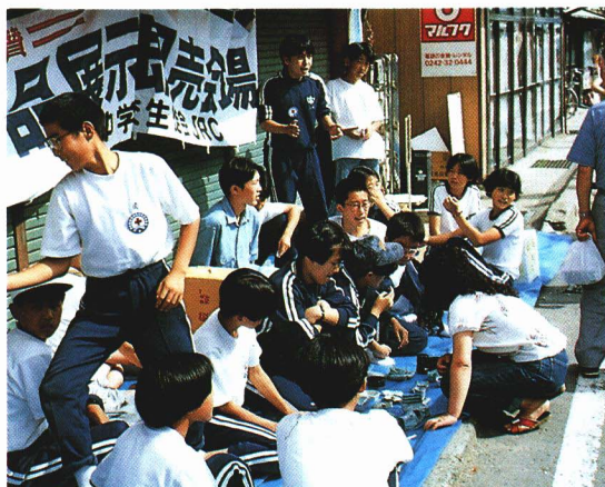
せと市で作品を販売する中学生