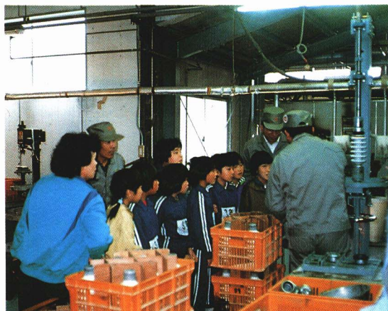
工場を見学する小学生