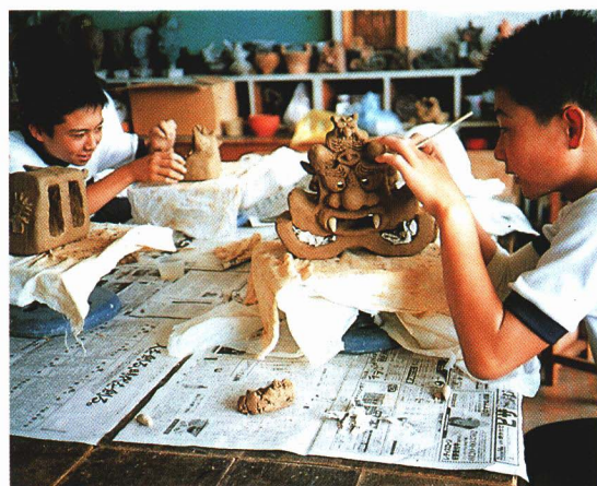
おにかわら ちょうせん 鬼瓦づくりに挑戦する中学生