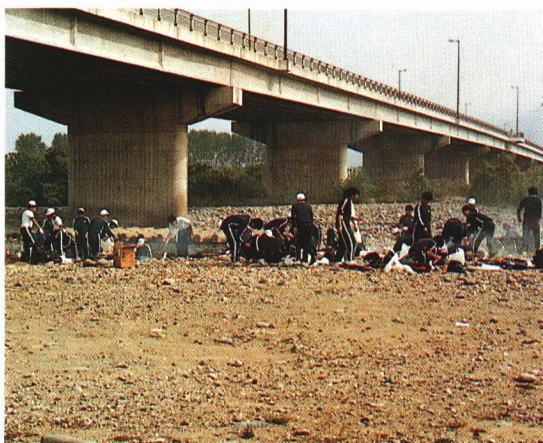
川原で芋煮 いもに を楽しむ中学生