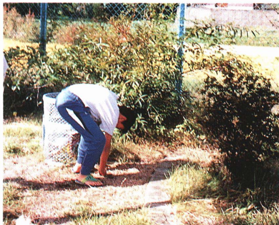
クリーンアップする小学生