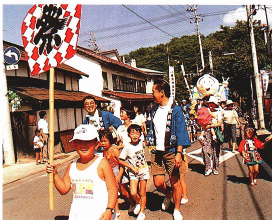
祭りに参加する子供