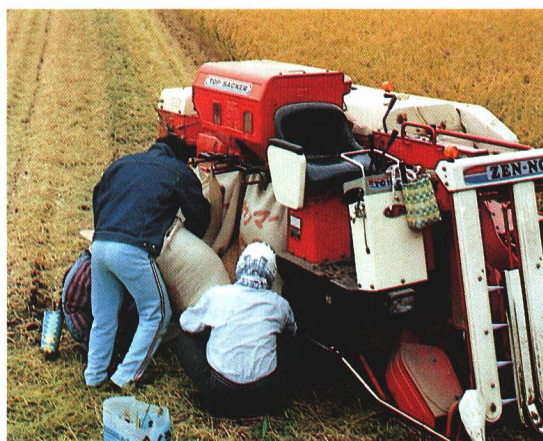
お父さんの手伝いをする中学生