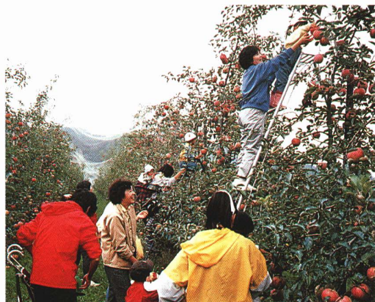
しゅう かく 収 穫

町では、米以外にも野菜やくだものづくりに力を入れています。また、町ではしいたけ工場など新しい農業のスタイルも目指しています。将来農業をやりたい、農家の跡どりとして家を継ぎたい、そんな子どもたちが増えてほしいものです。