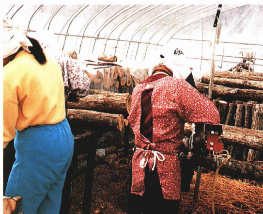
しいたけのハウス栽培 さいばい