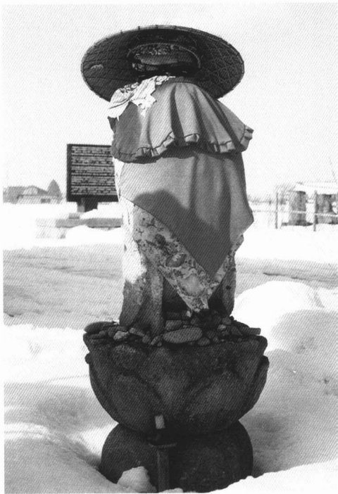
・名称 延命地藏尊 ・所在地 本郷 (円通寺) ・年代 不詳 ・高さ 120cm ・刻銘等