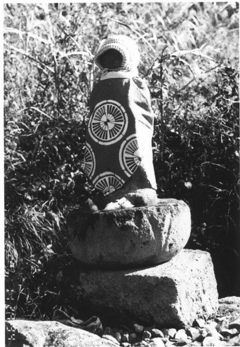
・名称 地藏尊 ・所在地 三日町 ・年代 不詳 ・高さ 127cm ・刻銘等