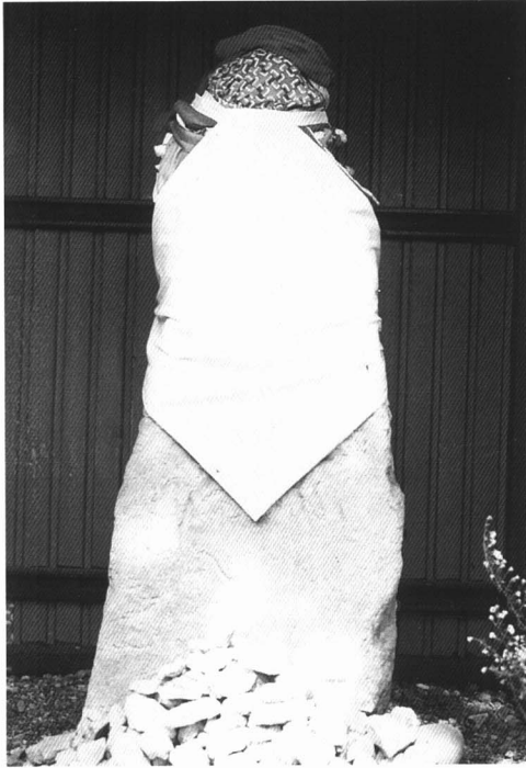
・名称 鳳皇地藏尊 ・所在地 大八郷 ・年代 南北朝時代 (1331~1392) ・高さ 111cm ・刻銘等 町指定文化財 (美術工芸品)