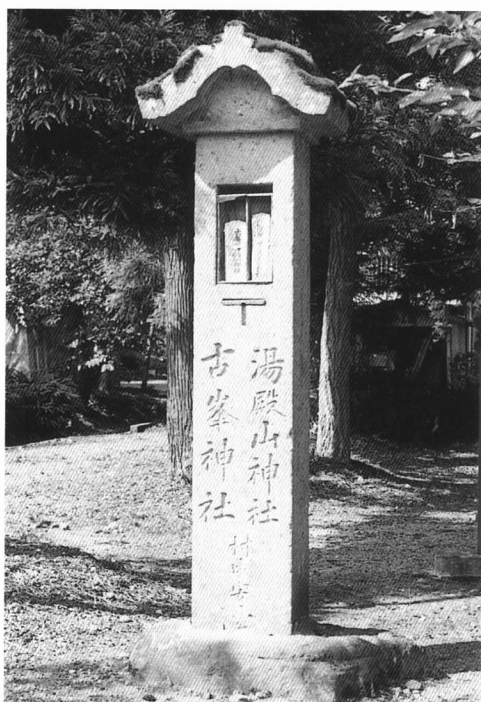
・名称 古峯神社 ・所在地 螺良岡 ・年代 昭和4年(1929) ・高さ 270cm ・刻銘等 湯殿山神社と村中安全