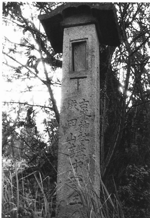
・名称 古峰神社 ・所在地 相川 ・年代 大正12年(1923) ・高さ 227cm ・刻銘等 大正12年8月1日 講中安全