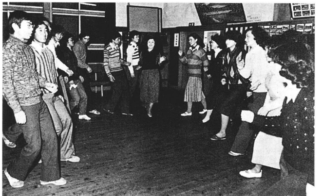
青年の集いで行われた「社交ダンス講習会」(昭和53年/広報から)