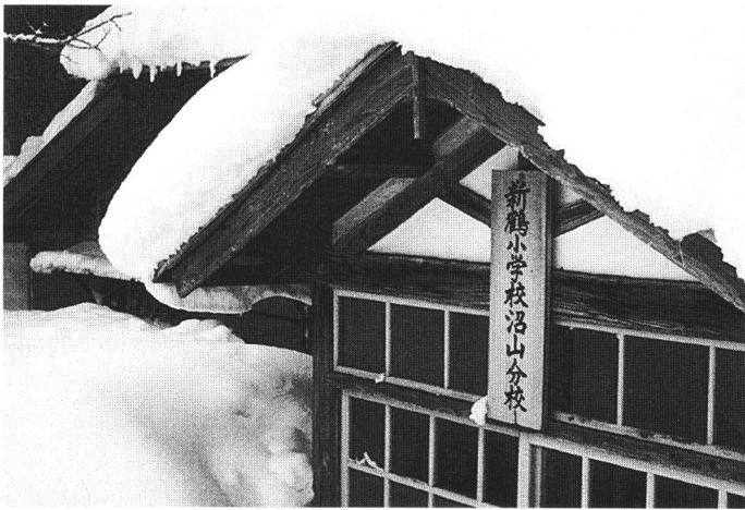
新鶴小学校沼山季節分校 (昭和54年頃)