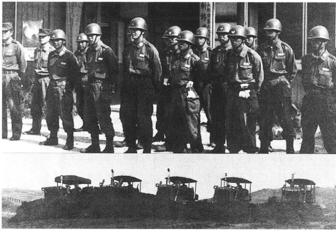
総合運動場整地に活躍する陸上自衛隊第6師団 (昭和54年/広報から)

◎総合運動場(広場)整地のため陸上自衛隊第6師団施設隊員延べ1700人導入 ◆イラン革命による第2次石油危機、ガソリンスタンドの日曜・祝日全面休業を実施◆第5回主要先進国首脳会議を東京で開催◆東京電力福島第1原子力発電所6号機が営業運転開始、6基の計画が完了