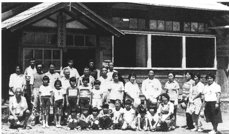
新鶴小学校沼山季節分校改築工事に着手 (昭和56年/広報から)