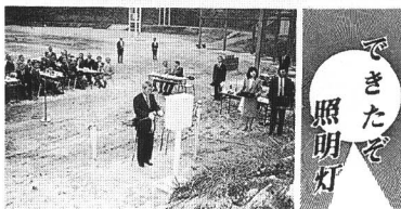
吹上公園運動場夜間照明施設完成 (昭和60年)