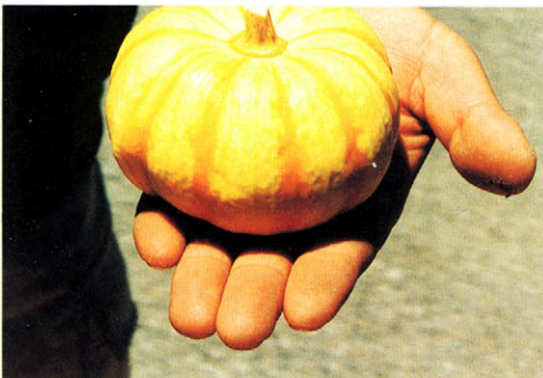
◀プチカボチャ (ばんげばんげ)

アスパラガスは、軽い作業ですむので、お年寄りの仕事にできしています。また、ねだんも高く売れます。現在プチカボチャを「ばんげばんげ」という名で特産品にしようと取りくんでいます。