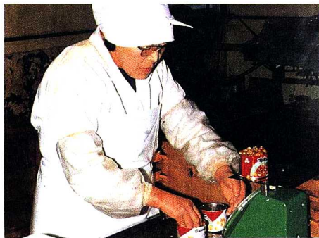
④肉づめ・計りょう かんとくに重さをはかっていきます。