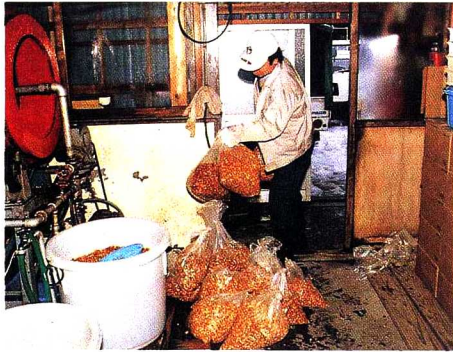
①生なめこ 原木やおがのなめこが運ばれてきます。