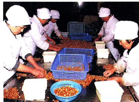
③手せんべつ 手でさらにいくつかに分けます。