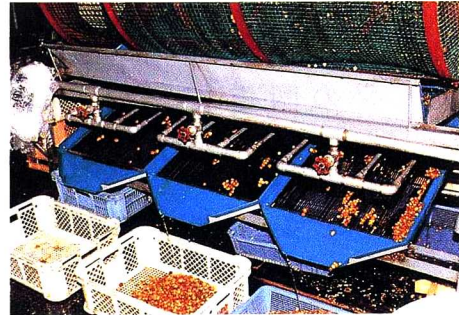
②きかいせんべつ 大ききごとにきかいによって分けられます。