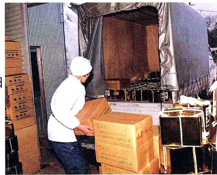
県内外に送り出されます。

ミックスびんづめの中には、わらび、うど、こごみ、うるい、なめこなどが入っています。