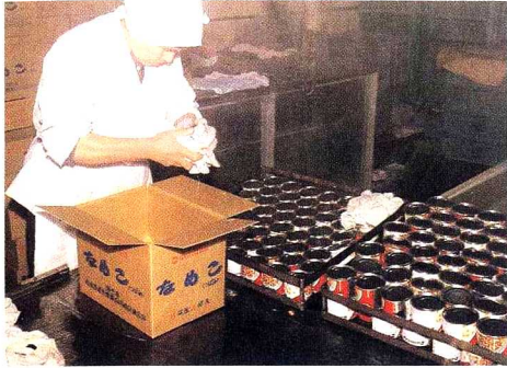
仕上げ 一つ一つていねいにしらべて はこにつめます。