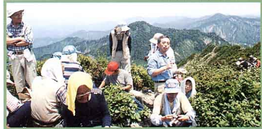
御神楽岳の頂上で

緑をました金山町の夏は、野尻川のアユ釣り、沼沢湖畔のキャンプ、沼沢湖水祭りなど、たくさんの観光客でにぎわいます。