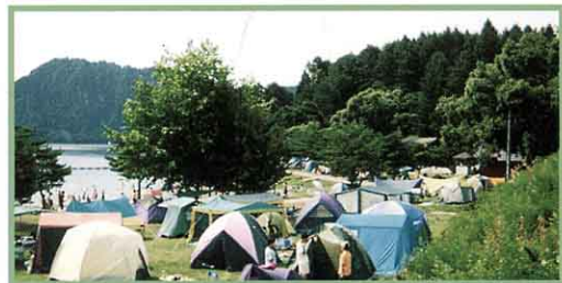
沼沢湖畔のキャンプ