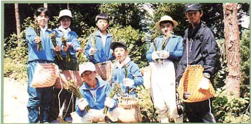
わらびとりを楽しむ

雪解けを待っていた春は、ぜんまいやわらびなどの山菜の恵みをもたらします。「会津が生まれた地」と伝えられている社を持つ御神楽岳の山開きは、毎年6月の第1日曜日に行われ、多くの登山客でにぎわいます。