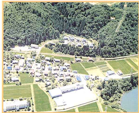
横田地区と横田小学校