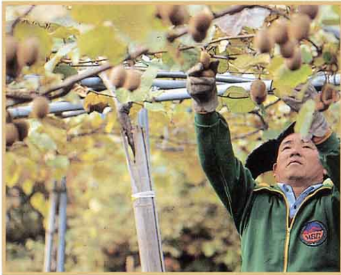
しゅうかくしているね。

※摘果(てきか)…大きな実を实らせるために育ちの悪い実や形の悪い実をつんでしまうこと。