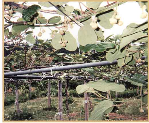
かわいい実ができたね。