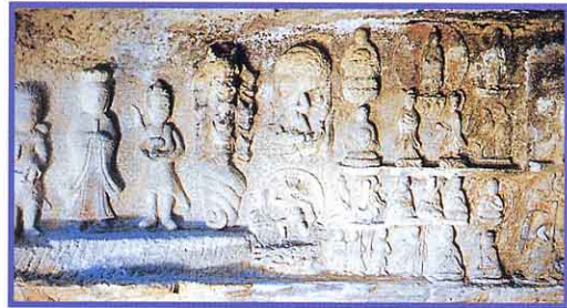
まがい 磨崖仏(鮭立の洞穴)