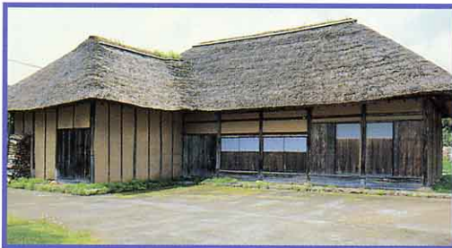
旧五十島家住宅 県指定 (沼沢の五十島吉次氏の住宅)