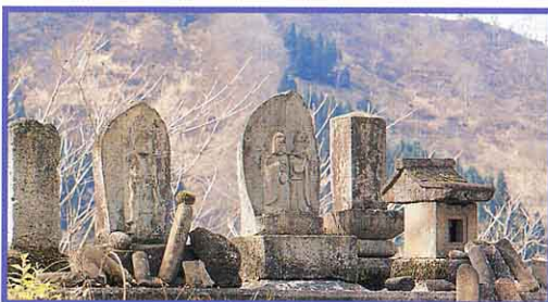
どうそじん 道祖神(小栗山)