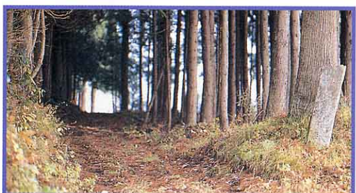
旧沼田街道(沼沢付近)