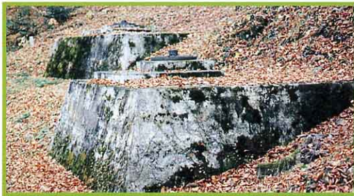
水源地（水を取り入れる）