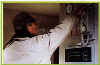
ときどき機械を点検する