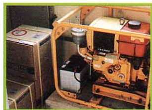
電気が止まっても自動的にポンプが動く