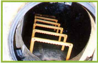
山から出る水を取り入れる