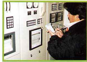
役場できんしている