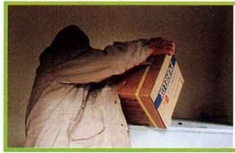
消毒えぎを入れる