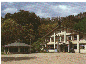
●昭和温泉しらかば荘