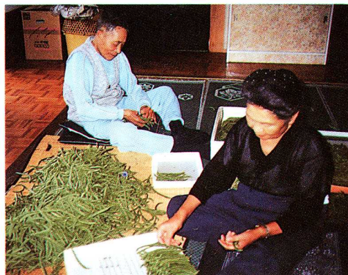
▲さやいんげん選別作業