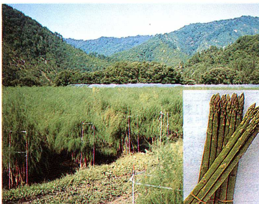
▲アスパラガス畑（収穫後）