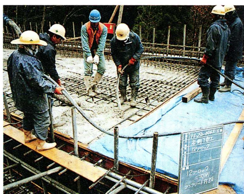
▲建設現場で働く人たち