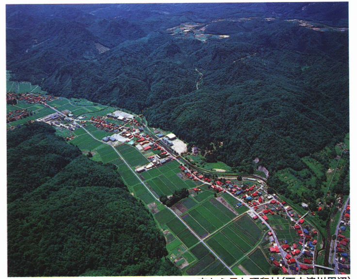
空から見た昭和村(下中津川周辺)

村の南端には国指定天然記念物の駒止湿原があり、高山植物が自生する高層湿原が広がっています。また、村の中域には珍しいハッチョウトンボが棲息する11haの矢の原湿原、玉川溪谷などがあります。