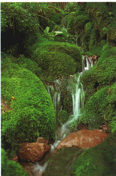
⑧冷湖の霊泉 [大芦・三階山] 昔、日照りで困っていたところ名主の夢枕に御神楽岳の天狗が現れて水のお告げをしたという天狗伝説が残る清冽な清水。