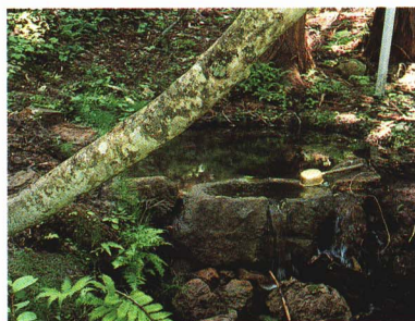
⑨源兵衛清水 [大芦・矢の原湿原] 姥石山付近に年老いた母を捨てなくてはならなかった源兵衛の悲しみの涙が清水となって湧き出したという言い伝えの残る深層水。