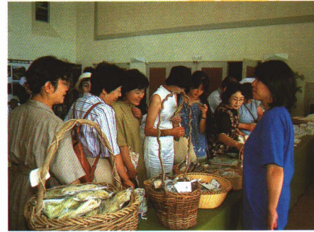
工芸品の販売(からむし織の里フェア)