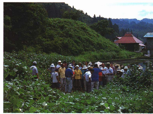
からむし栽培地にて

村の名産品であるからむし織を、多くの人々に広く知ってもらおうとはじめたイベントで、からむし織りの見学や体験などから学んでもらいます。