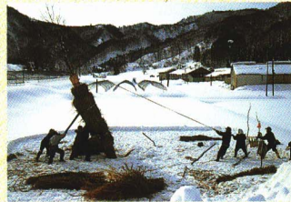
1月15日の歳の神は、大岐地区にて