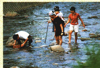
お盆に帰省した子供たちの、清流での川遊び