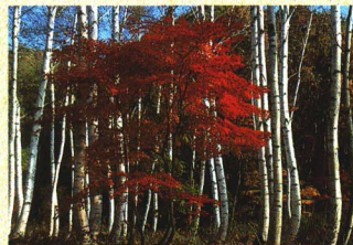
博士峠入口の秋の白樺群生地

冬の風物詩・凍み大根と凍み豆腐。自然の恵みを体いっぱいを受けて、独特の風味を醸し出してくれます