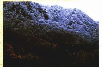
喰丸峠から見る冬将軍の訪れ