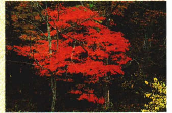
博士峠の紅葉は小野川から