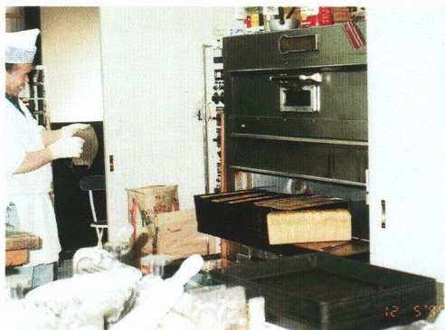
▲パンを焼くオーブン