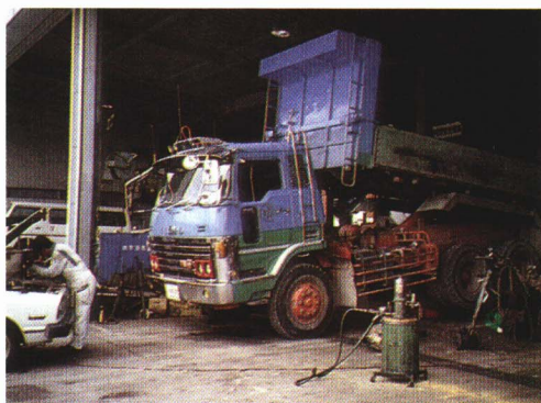
▲自動車 じどうしゃ の点検 てんけん 、修理 しゅうり