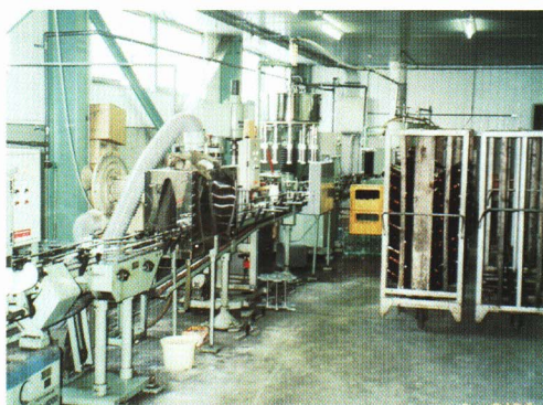
▲お酒をビンづめするきかい