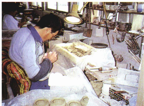
▲やき物 もの づくり