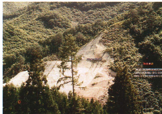
▲建設中の田島ダム（高野） 平成10年完成予定