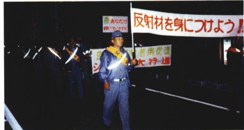
▲反しゃ材着用シルバー大行進