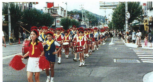
▲交通安全パレード