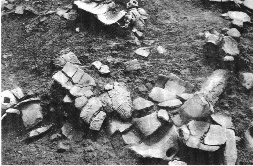
▲寺前遺跡から発掘された土器