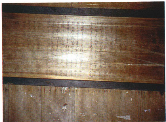
▲和算の額（永田鷲神社）