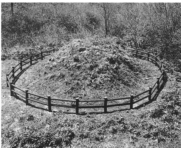
43 大内峠一里塚（施工後）