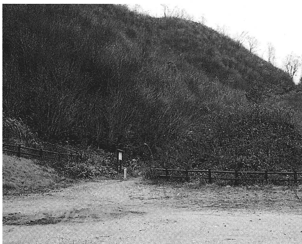
42 大内峠一里塚（施工後）