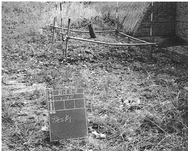
40 三郡境の塚（施工前）