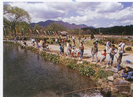
養鱒公園いこいの広場