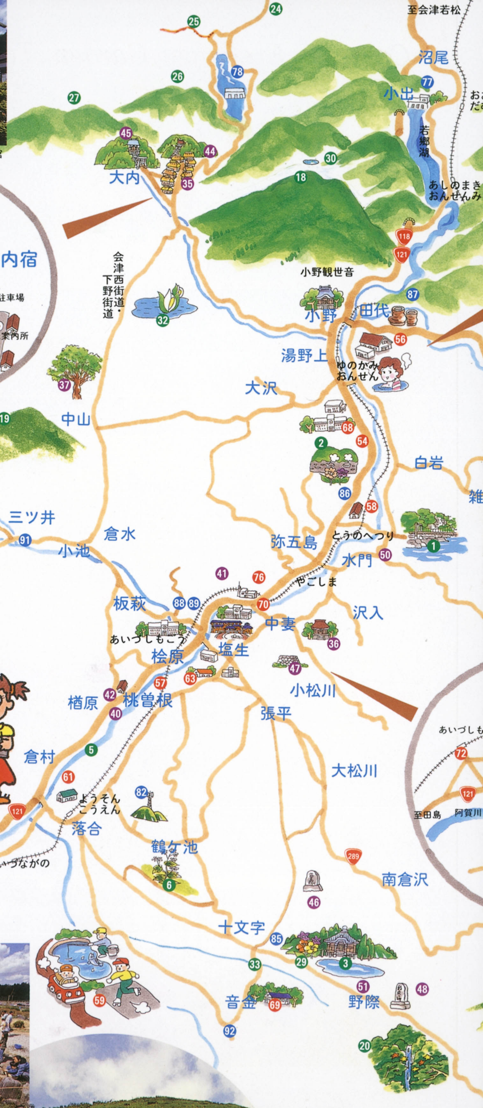
至大峠を経て那須へ