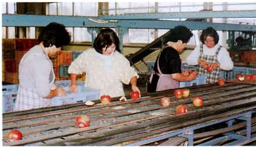
◀りんごのせんかのようす