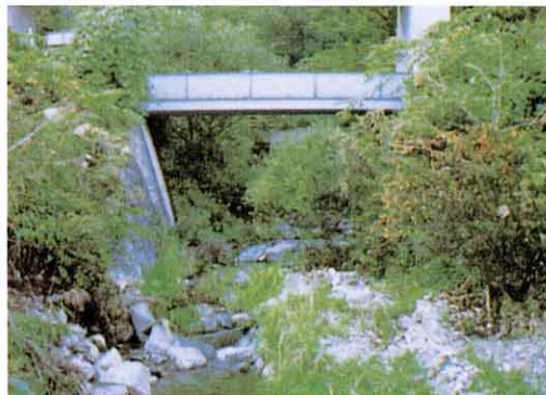
㉟ 沢の上を渡る円蔵せき