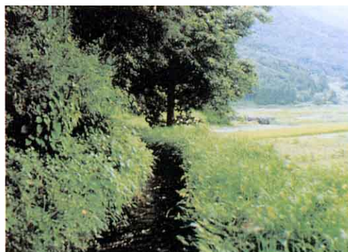
㉡ 山ぎわを通る水路