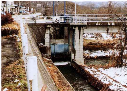
㉞ 長野向かいの取り入れ口