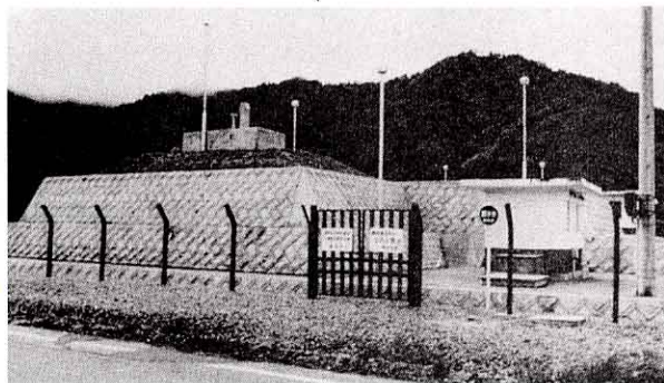
上郷地区かんい水道