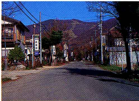
◀現在の高杖原から見たスキー場