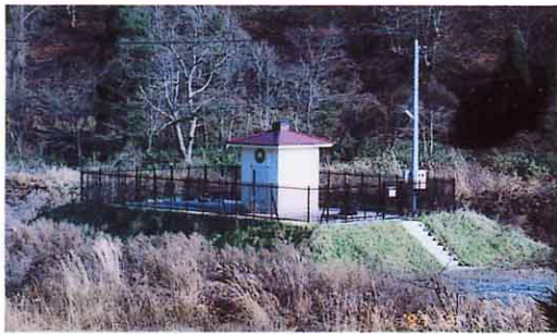
うちかわはじかせ 内川耻風の水源地

村では、人々のけんこうとえい生のために多くの費用をかけて浄水場を作りました。そのおかげで各地区にきれいな水がくるようになりました。