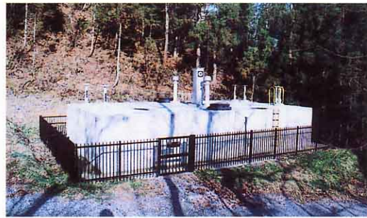
内川耻風の水源地