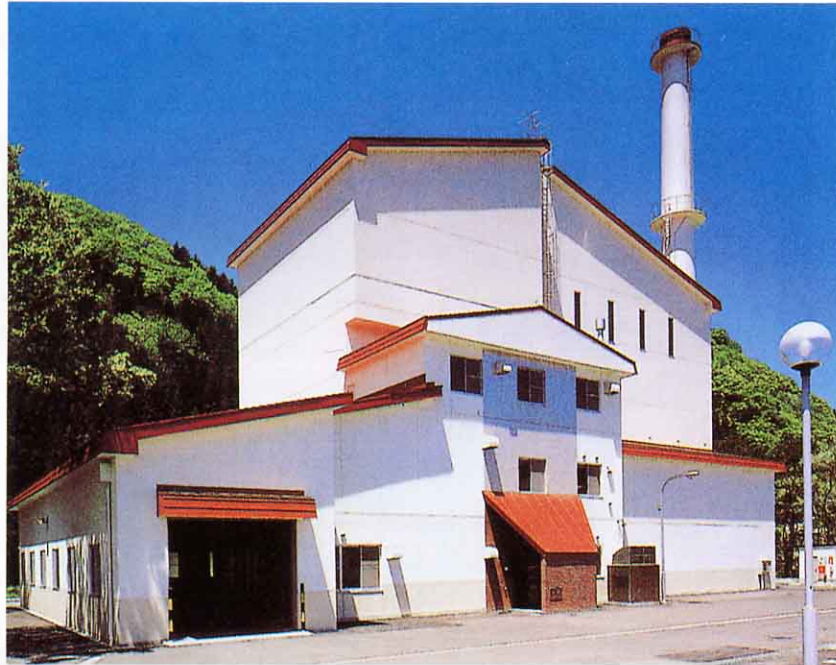
西部環境センター