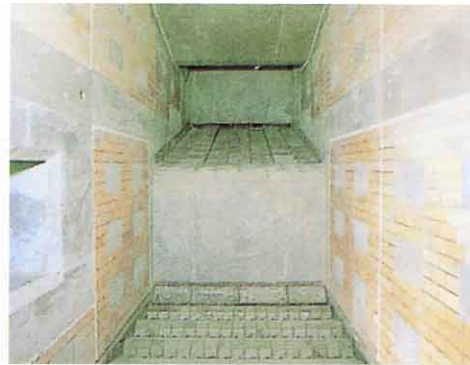
しょうやくろ 焼却炉内部

階段上になっており、下にいくまでに完全に焼却し、無害化します。内部温度は800～900℃になります。