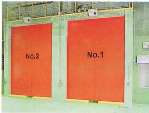
どうにゅうとびら ごみ投入扉