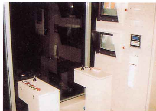
そうさき ごみクレーン操作機