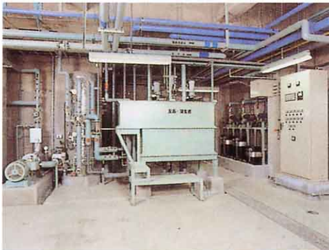
プラント排水処理装置