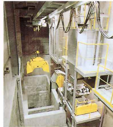
灰ピット・灰クレーン