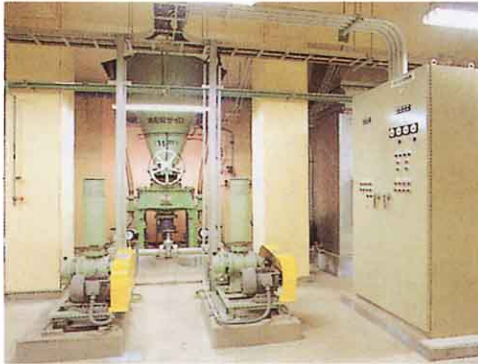
有害ガス除去装置