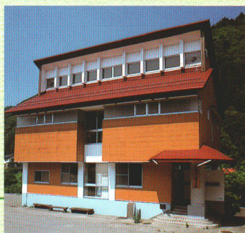
公衆浴場“燧の湯2号館”