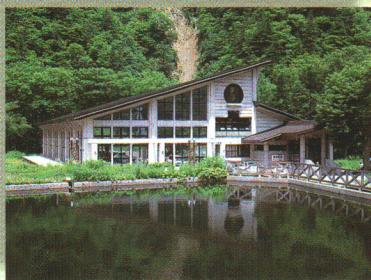
アルザ尾瀬の郷の全景