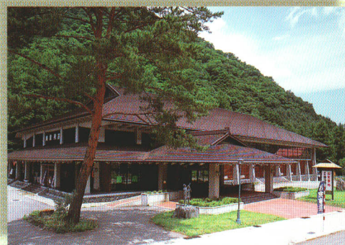
アルザ尾瀬の郷に隣接、 檜枝岐の味と特産品がそろった 尾瀬の郷交流センター（レストラン・体育館）