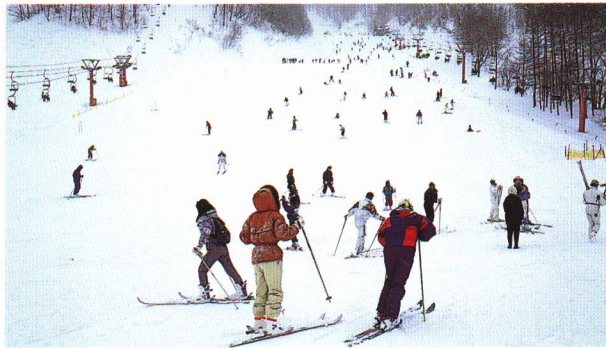
尾瀬檜枝岐温泉スキー場