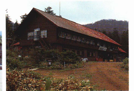
尾瀬沼ヒュッテ(村営)