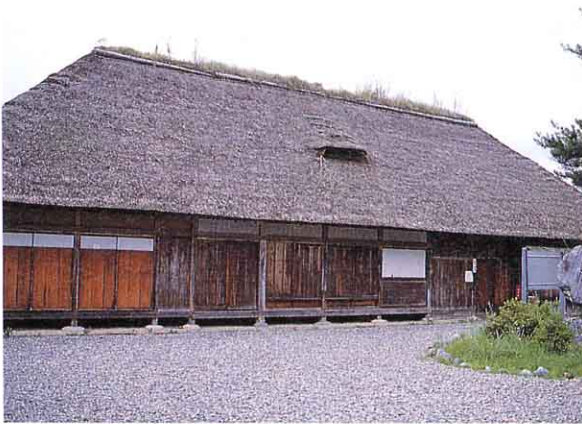
▲ 県指定重要文化財 旧山内家

さゆり荘の近くにある旧山内家住宅は、250年いじょう前のもので、県や村でたいせつにしている家です。