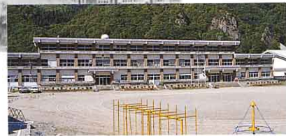
▲今の一小 (昭和54年3月完成)