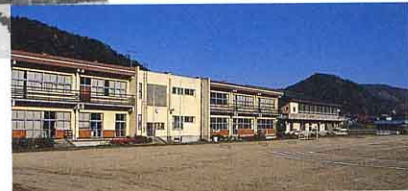
▲今の二小 (昭和47年12月完成)

今から120年くらい前、山口・木伏・鶺鴒・片貝・和泉田に学校 ができました。そのころは、学校としての建物はなく、農家やお寺 をかりて勉強をしていました。今の一小・二小となるまでには、学 校の名前、位置や建物もうつりかわってきました。うつりかわりの 様子を調べてみましょう。