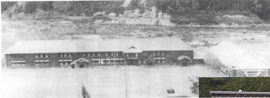
▲昭和9年の南郷第一小学校 (大宮小学校) (今の南郷体育館の所)